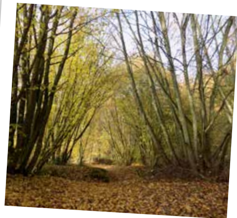
Bois de Conty

Retrouvez les animations et sorties nature en téléchargeant l'Agenda Somme Sud-Ouest ou en suivant l'actualité et les événements du service : www.cc2so.fr/culture-et-loisirs/tourisme