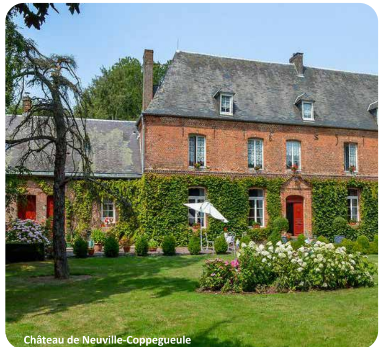
Château de Neuville-Coppegueule

Contact : 09 85 12 85 55 (laisser un message si nécessaire) gcartier01@gmail.com 12, rue Jean Moulin - 80430 Neuville-Coppegueule