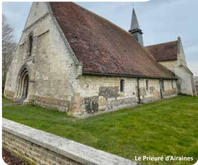
Le Prieuré d'Airaines