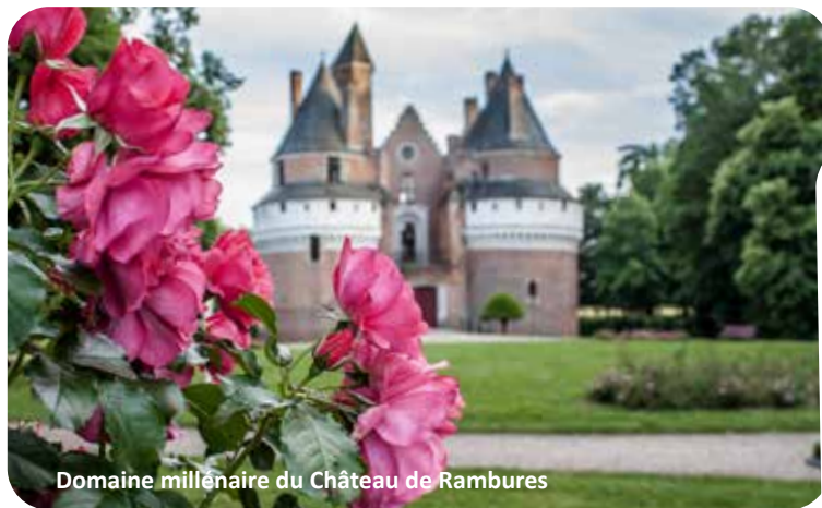
Domaine millénaire du Château de Rambures

1, chemin de Belloy - 80270 Tilly-l'Arbre-à-Mouches