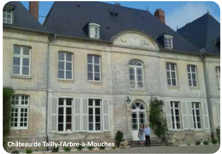
Château de Tilly-l'Arbre-à-Mouches

Parc du Château - 80270 Quesnoy-sur-Airaines