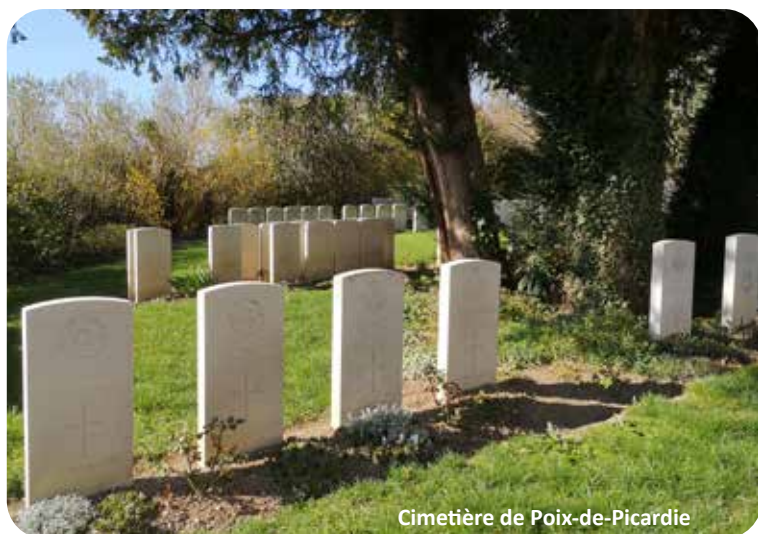
Cimetière de Poix-de-Picardie