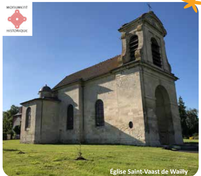
Église Saint-Vaast de Wailly

Contact : Association des Amis des Églises de Conty et de Wailly - assoeglisescontywailly@outlook.fr 06 07 08 94 84 - Rue de l'Église - 80160 Conty