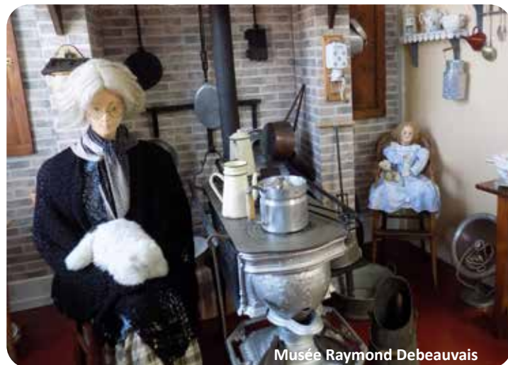
Musée Raymond Debeauvais

Contact : 03 22 25 65 86 - 03 22 25 23 30 - 07 77 49 58 23 18, rue Sadi Carnot - 80140 Oisemont