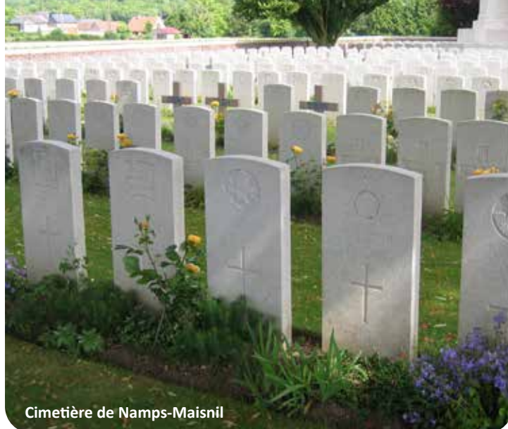
Cimetière de Namps-Maisnil

Rue de la Maladrerie - 80290 Namps-Maisnil