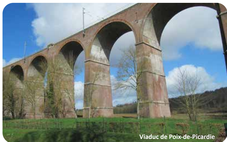
Viaduc de Poix-de-Picardie