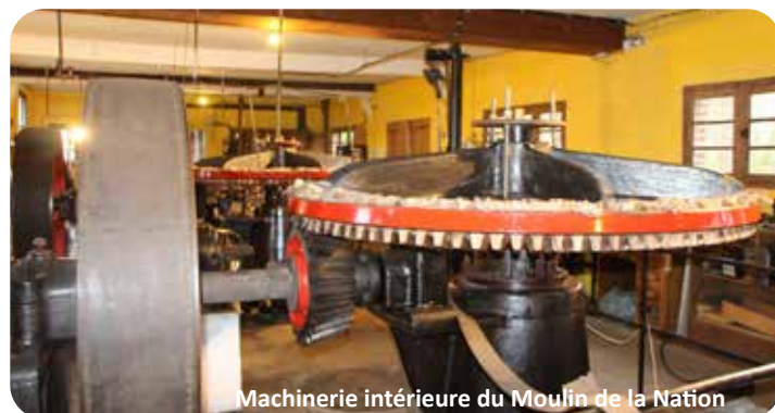
Machinerie intérieure du Moulin de la Nation

Visibles uniquement sur la voie publique.