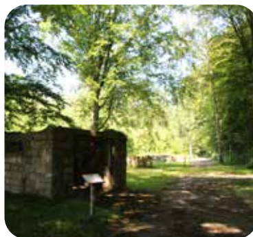
Base de lancement