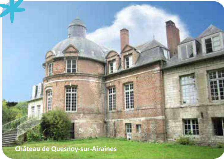
Château de Quesnoy-sur-Airaines