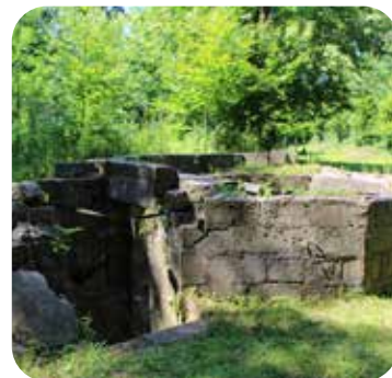
Parc du château d'Avesnes-Chaussoy