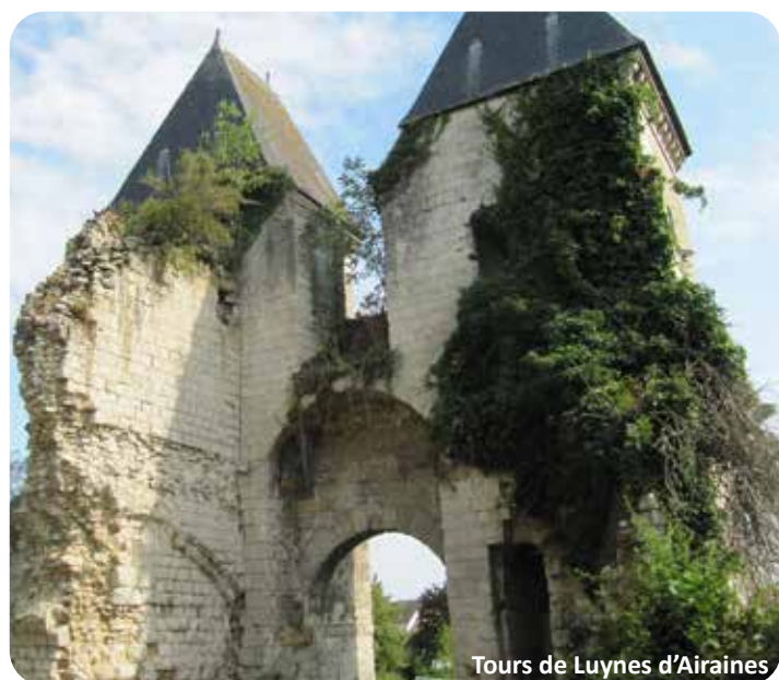
Tours de Luynes d'Airaines

Dans cette nouvelle catégorie, vous pourrez découvrir des lieux inhabituels ou vous étonner des croyances locales. Vous proposer la découverte de ces lieux nous permettra de contenter les plus curieux d'entre vous, les plus intimistes qui rechercheront des lieux moins fréquentés, ou les habitués qui voudront redécouvrir la Somme Sud-Ouest.