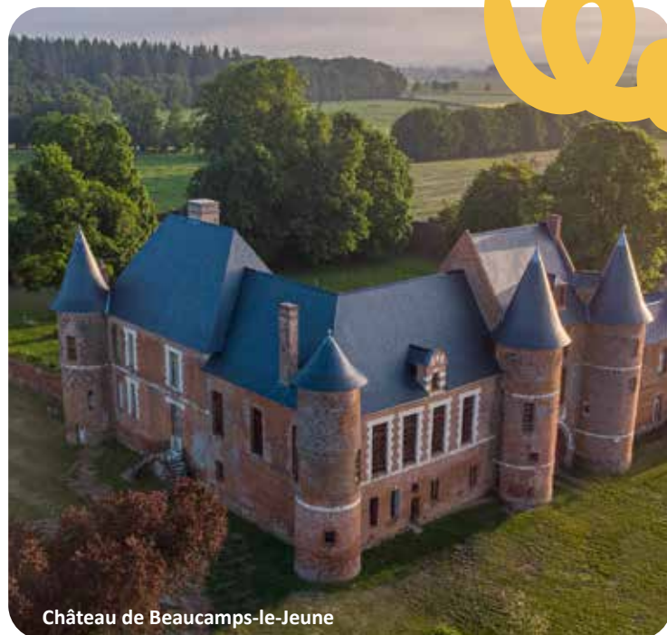
Château de Beaucamps-le-Jeune

Contact : 06 30 67 06 65 2, rue Chanteraine - 80430 Beaucamps-le-Jeune