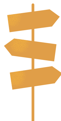
Maison Sadi Lecointe

3, rue d'Aumale - 80430 Beaucamps-le-Jeune